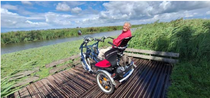
April doet wat hij wil en daar kwam de eerste DUO-fiets in Warten! En direct een succes!