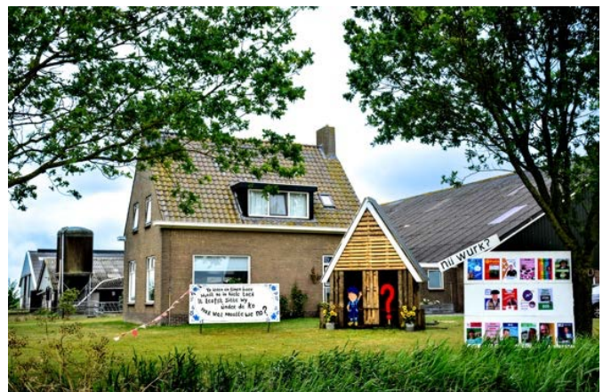
De Wartenster Merke, die dit jaar in het teken stond van 'Beroepen door de tijd heen...'