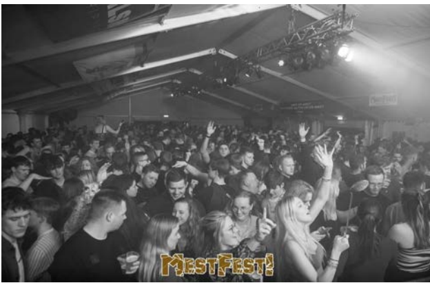
En toen was het maart, tijd voor het Mestfest!