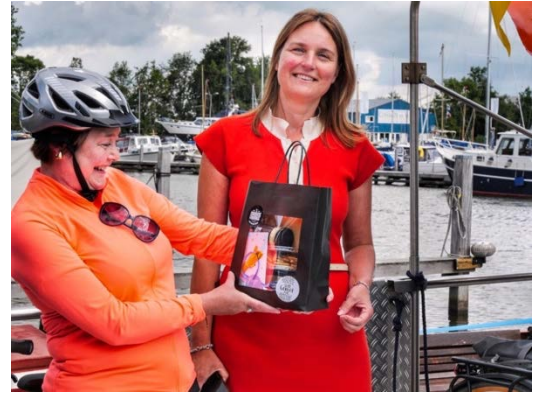
Juli brak aan en de 250.000 e passant van Zonnepont De Oerhaal werd in het zonnetje gezet...