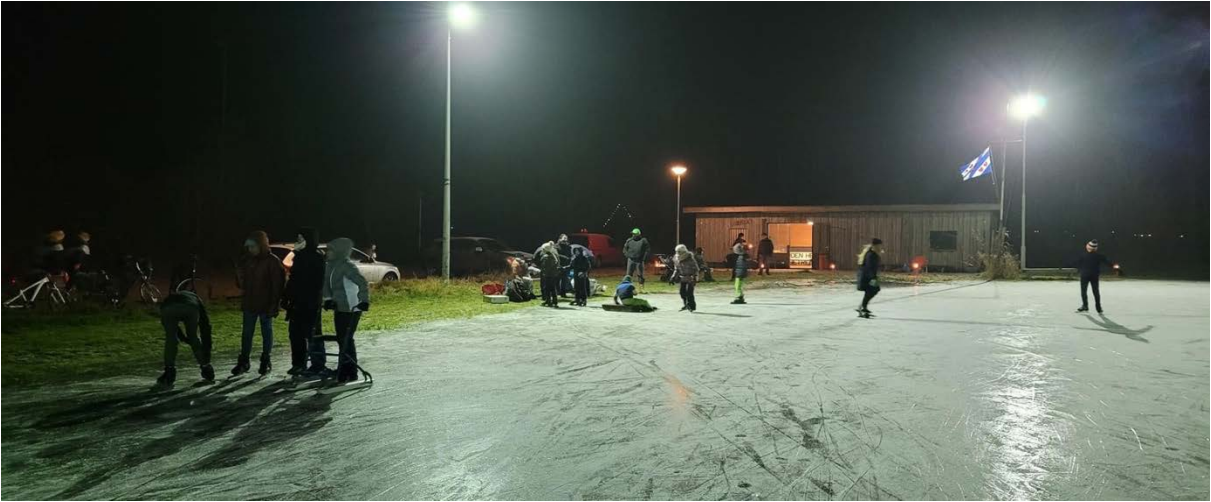
Januari, een ijskoud Warten, dus schaatsen maar...!