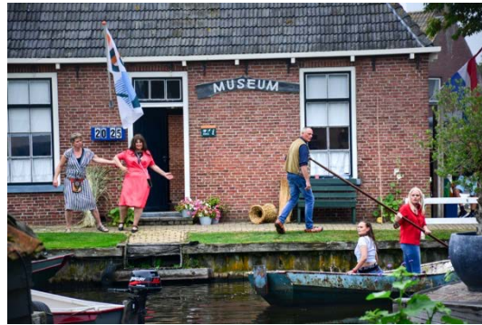
Feestelijk was ook het 50-jarig bestaan van het Museum Warten in oktober, het geheel opgeluisterd met mooie woorden, muziek, een hapje, drankje en lekkere stampotten!