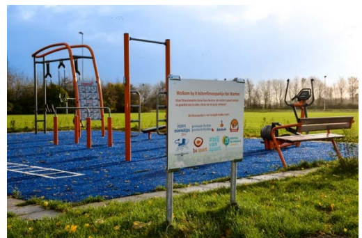
Rennen door de modder en nieuwe buiten-fitnessstoestellen!