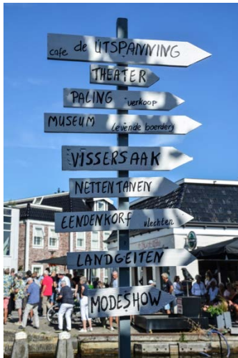
In september groot feest tijdens de Wartenster Wetter Wille; ook het weer werkte mee!