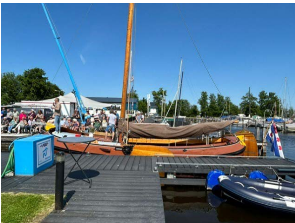
En voor je er erg in hebt is het juni, met vele activiteiten..., te beginnen met het Havenfeest!