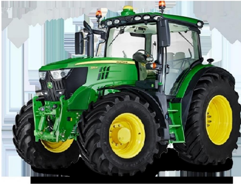
DE NIJSTE 6 R SERIE VAN JOHN DEERE IN BOPPELACH LMB TH. ZWART B.V. WERGEA 058-2551201